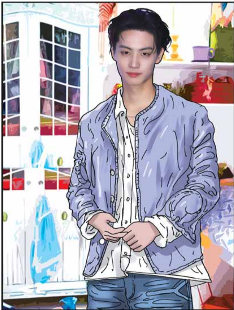
숨은 그림 : 몽당연필, 골프채, 다람쥐, 새총, 쫓불, 파리, 커피잔