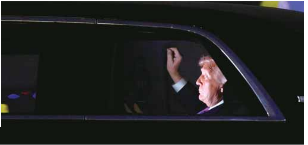
도널드 트럼프 미국 대통령이 11일(현지시간) 메릴랜드 앤드루스 합동기지에 도착한 뒤 백악관으로 이동하기 위해 대통령 전용 리무진 ‘더 비스트’에 탑승해 있다. 작은 사진은 이란 드론의 공격을 받은 오만 살랄라의 석유 저장시설에서 불길이 치솟는 모습.

도널드 트럼프 미국 대통령은 11일(현지시간) 이란과의 전쟁에 대해 “우리가 이겼다”면서도 임무를 마칠 때까지 군사작전을 계속하겠다고 밝혔다.