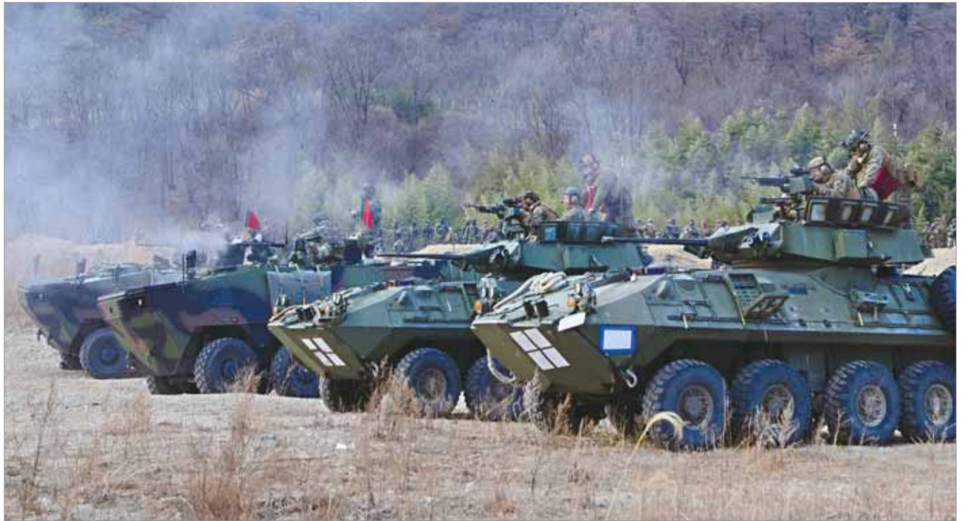
한미 해병대 장병들이 지난 9-12일 해병대연합훈련(KMEP)의 하나로 진행된 연합 기계화훈련에서 K808 차륜형 장갑차와 LAV 수륙양용 장갑차에 탑승해 사격하고 있다.

1사단 32대대, 연합 기계화훈련 실시 주야간 사격·팀 단위 전투 절차 숙달