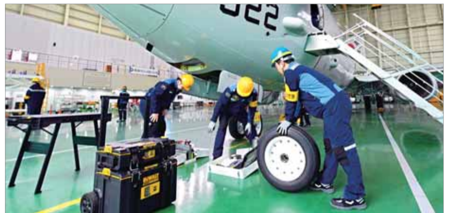
해군항공사령부 65전대 653대대 긴급수리반이 12일 열린 항공기 긴급복구절차 훈련에서 P-8A 해상초계기 하부와 타이어를 긴급 수리하고 있다.

은 “항공작전을 지속적으로 수행하기 위해서는 파손된 항공기를 신속히 복구하는 능력이 매우 중요하다”며 “앞으로도 해상항