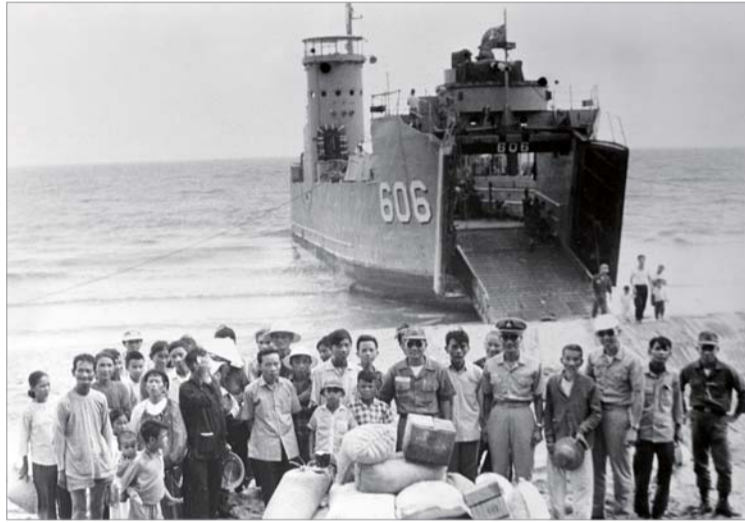
베트남전쟁에 참전한 거문함(LSM-655)이 월남 민간인들에게 구호물자를 전달하고 있다.

6·25전쟁 이후 전력을 가다듬은 북한은 1958년부터 본격적으로 무장간첩선을 침투시켰다. 초창기 무장간첩선은 12노트 속력